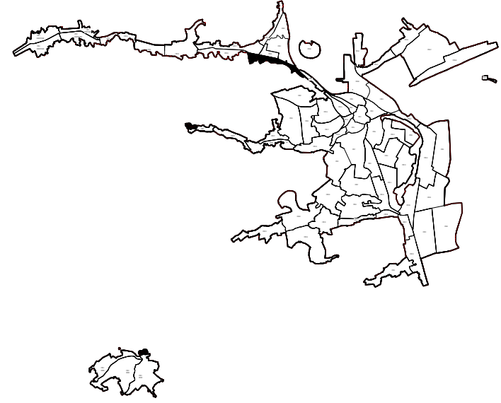
INCADRARE IN TERITORIU

REGLEMENTARI M.1.a.5. -ZONA MIXTA CONSTRUITA IN LUNGUL UNOR STRAZI CU CAPACITATE DE PRELUARE A UNUI TRAFICAGLOMERAT, MIXITATEA FUNCTIONALA SI DENSITATE RIDICATE SUNT INCURAJATE, CUPRINZAND SUBZONA MIXTA FORMATA PRIN INSERTIA DE FUNCTIUNI MIXTE SI CONVERSII ALE LOCUINTELOR IN ALTE FUNCTIUNI, IN FRONTURILE EXISTENTE CONSTITUITE DIN CLADIRI CU INALTIMEA MAXIMA P+2; L.1.a.1. -ZONA DE LOCUINTE INDIVIDUALE MICI EXISTENTE CU MAXIM P+2 NIVELURI, IN TERITORIU CU PARCELARI TRADITIONALE RETRASE DE LA ALMIAMENT CU REGIM DE CONSTRUIRE DISCONTINUU, SITUATE IN AFARA ZONEI DE PROTECTIE; V.3.a. -ZONA SPATII VERZI PENTRU PROTECTIA CURSURILOR DE APA SI A ZONELOR UMEDE; R.N.at.-ZONA CE NECESITA MASURI DE PROTECTIE IMPOTRIVA ALUNECARILOR DE TEREN ZONA DE PROTECTIE A DRUMURILOR JUDETENE ESTE DE 20m DIN AXUL DRUMULUI, IN INTERIORUL CAREIA ESTE INTERZISA ORICE ACTIVITATE CARE PRODUCE PREJUDICI CALITATII DRUMULUI SAU DERULARII IN SIGURANTA A TRAFICULUI.